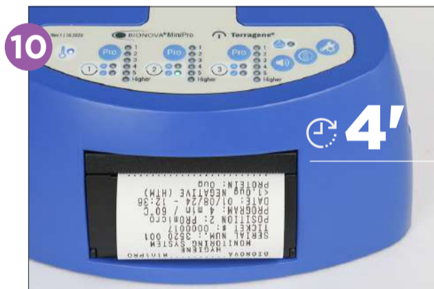
10 Espere a que la lectura termine (4 minutos); la Auto-lectora emitirá bips 30 segundos antes de mostrar e imprimir el resultado.