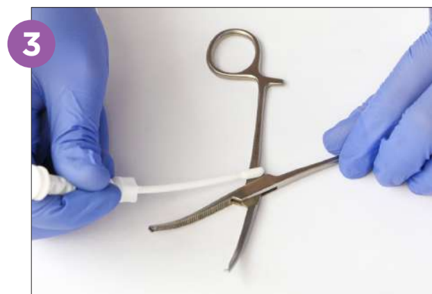
3 Hisope el área más desafiante del instrumento presionando y girando varias veces el hisopo mientras toma la muestra.