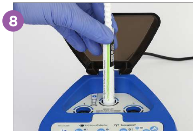
8 Coloque el dispositivo PRO1 MICRO en la posición de lectura, empuje el lápiz hasta el fondo y asegúrese de que no gire.