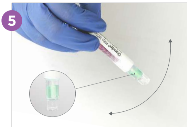
5 Agite fuertemente hacia abajo por 15 segundos para que el líquido baje al cono de lectura y la solución se vuelva verde.