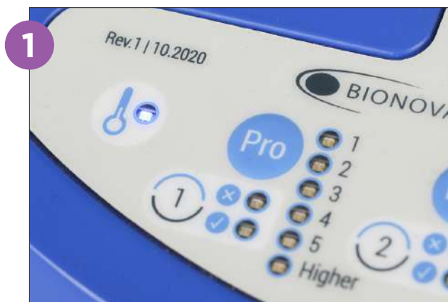
1 Encienda su Auto-lectora y espere a que la temperatura se estabilice en 60 °C (la luz de temperatura dejará de parpadear).