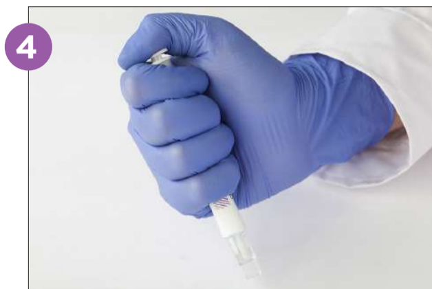
4 Coloque el hisopo en el dispositivo PRO1 MICRO y presione con firmeza para empujarlo dentro del cono de lectura.