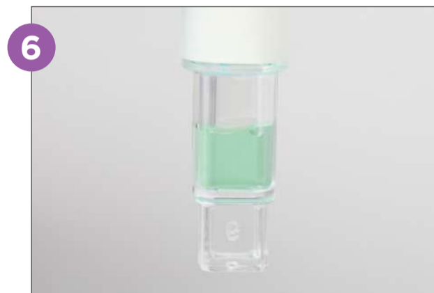
6 Mueva el hisopo hacia arriba y agite nuevamente para que todo el líquido baje al cono de lectura. Comience la lectura del dispositivo PRO1 MICRO de inmediato.