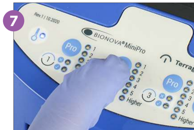
7 Presione el botón PRO de su Auto-lectora por 3 segundos para activar la posición de lectura. Un bip confirmará la activación.