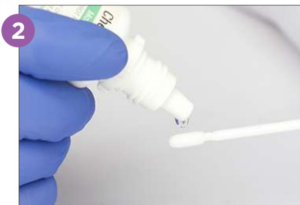
2 Retire el hisopo y aplique 2 gotas de humectante en el extremo.