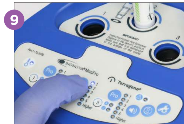
9 Empiece el proceso de lectura presionando el botón PRO por 1 segundo. Los LEDs verdes y rojos de la posición empezarán a parpadear.